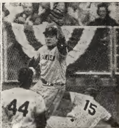
Aki nos ta mira algun momento di e prome cinco weganan di e Serie Mundial di Baseball. Entre otro e domingano Alou ponendo e base pa e victoria di Gigantes den e di cuater encuentro. Riba e otro nos ta mira Tony Kubek regreando precipitadamente pa segunda base.